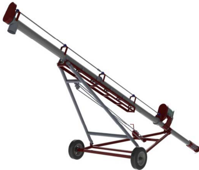
TRANSPORTADOR HELICOIDAL DE ALTURA VARIABLE

EL EQUIPO CUENTA CON NEUMATICOS PARA SU TRASLADO EN PATIOS Y BODEGAS, TIENE INTEGRADO UN SISTEMA DE AJUSTE DE ALTURA DE DESCARGA, WINCH CON CLUTCH O BIEN ACTUADORES MECANICO, HIDRAULICO SEGÚN EL MODELO.