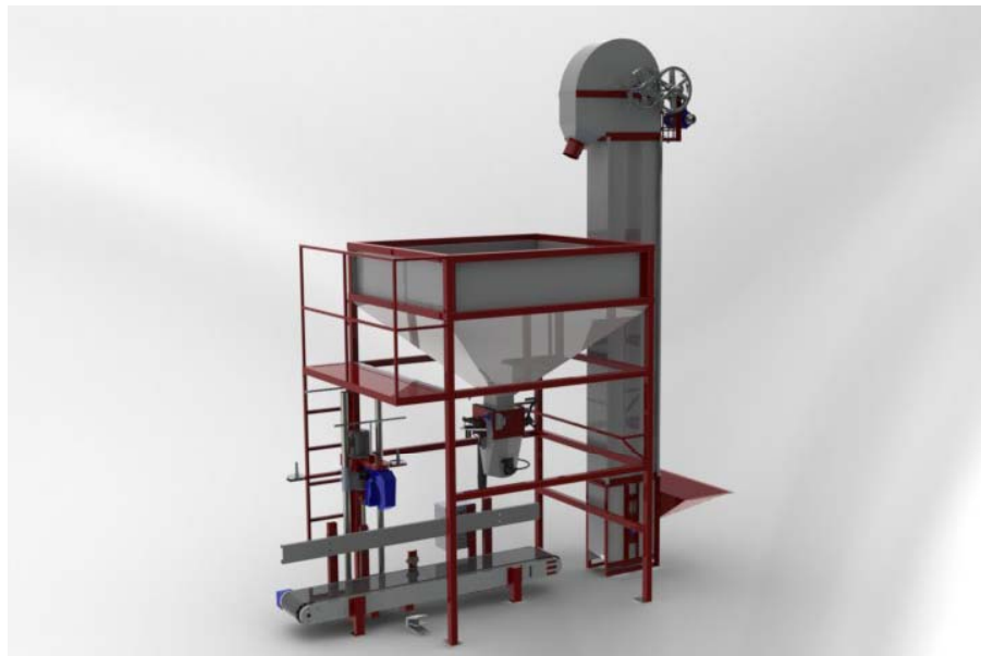
ELEVADOR DE CANGILONES PARA ALIMENTAR TOLVA ENVASADORA

SE FABRICA DE ACUERDO AL REQUERIMIENTO DEL CLIENTE, PUEDE SER DEPENDIENDO DEL TIPO DE APLICACIÓN, CONTINUO O CENTRIFUGO, DE CANGILONES DE POLIETILENO O CANGILONES DE ACERO, ASÍ COMO LA ALTURA Y ACCESORIOS COMO ESCALERILLA DE INSPECCIÓN Y ANDADOR DE MANTENIMIENTO (NO INCLUIDOS).